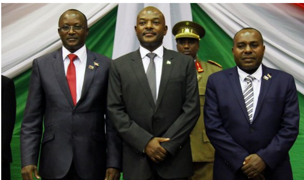
Photo du Feu président Pierre Nkurunziza et ses deux vice-présidents Gaston Sindimwo et Joseph BUTORE (2015-2020).

“La manipulation constitutionnelle du président du Burundi Pierre Nkurunziza en avril-mai 2015, visant un troisième mandat, a conduit à une rupture des accords d’Arusha de 2000 pour la paix et la réconciliation [1]. La plupart des opposants ont quitté le pays et certains ont été assassinés. La presse est aujourd’hui muselée. Les mouvements d’opposition des rues ont été très durement réprimés. L’armée est en voie de décomposition avec forte tension avec le pouvoir politique et ethnicisation. L’économie « formelle » a subi de plein fouet les effets de la crise politique et des mesures de sanction mises en œuvre notamment par l’Union européenne[2]».