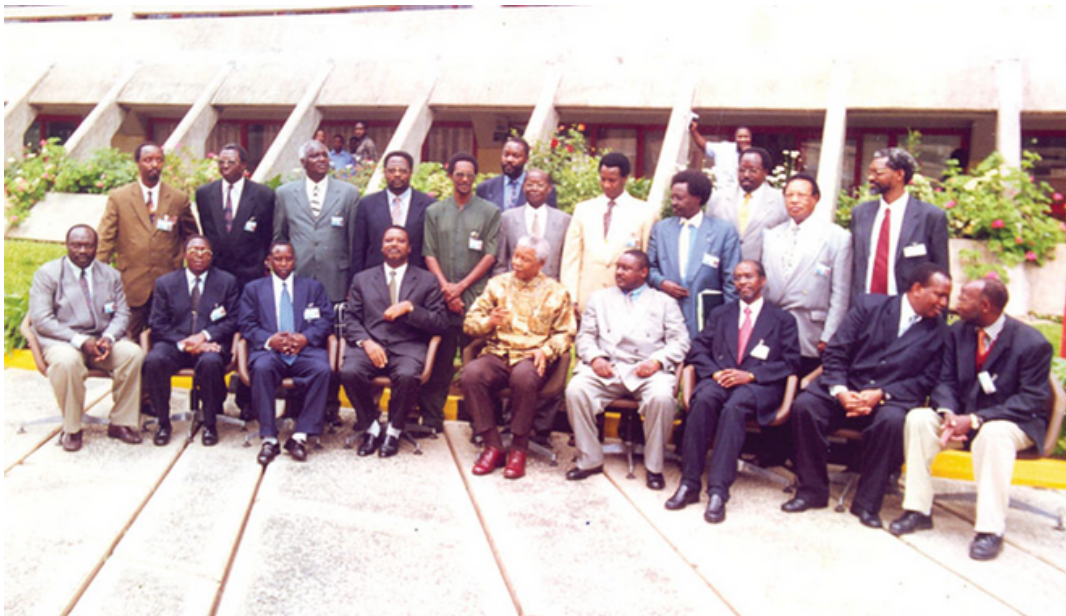
Photo de famille après la signature de l'accord d'Arusha en août 2000

L'accord d'Arusha est un texte de près de 200 pages formé de différents protocoles sur le conflit et ses solutions, la démocratie et la bonne gouvernance, la paix et la sécurité, et enfin la reconstruction et le développement[10]. Le pays est retombé dans le cycle de violence auquel l'Accord d'Arusha, signé le 28 août 2000 sous l'égide de Nelson Mandela et les garants, avait donné les pistes de sortie. C'est-à-dire « un conflit fondamentalement politique avec des dimensions ethniques extrêmement importantes ; d'un conflit résultant de lutte de la classe politique pour accéder au pouvoir et/ou s'y maintenir ». [11]