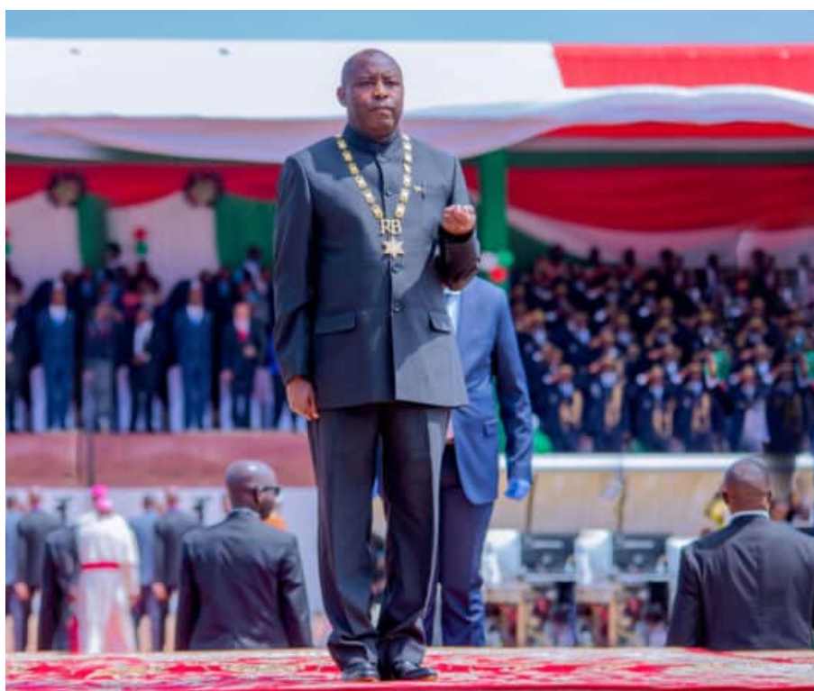
Le nouveau président du Burundi Evariste Ndayishimiye lors de son investiture (juin 2020)

Le décès inopiné du président sortant Pierre Nkurunziza survenu le 8 juin 2020 n'a pas permis une passation normale de pouvoir au nouveau président élu. C'est ainsi que la Cour constitutionnelle du Burundi a été saisie par le gouvernement sortant.