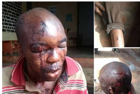
un membre du parti CNL tabassé par des Imbonerakure en commune Vumbi, province Kirundo