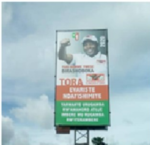
Campagne électorale précoce

d'Evariste Ndayishimiye et de Pierre Nkurunziza avec des écrits " Tora Evariste Ndayishimiye", ce qui signifie « Votez pour Evariste Ndayishimiye ».